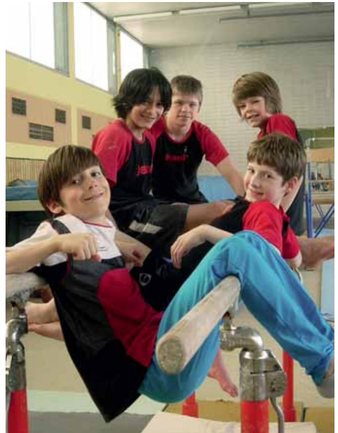
Für die Kinder und Jugendlichen in unseren Vereinen tragen wir eine besondere Verantwortung.

Mit dem Begriff „sexualisierte Gewalt“ wird die sexuell motivierte Aktion einer Person gegen abhängige Kinder, Jugendliche und Erwachsene zum eigenen Vorteil verstanden. Sexualisierte Gewalt ist folglich eine Handlung, welche die sexuelle Intimsphäre des anderen verletzt. Nach Angaben des Deutschen Kinderschutzbundes enthält die sexualisierte Gewalt folgende Komponente: