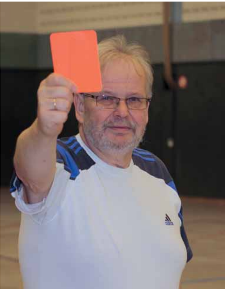
Rote Karte für Grenzverletzungen! Die Verantwortlichen der DJK-Vereine sind aufgerufen, Präventionsmaßnahmen zum Schutz vor sexualisierter Gewalt einzuführen und gleichzeitig für einen fairen Umgang unter allen Vereinsmitgliedern zu sorgen.